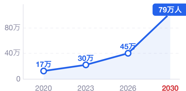
IT人材不足の推移 経済産業省調査